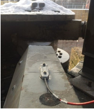
Jauges de contrainte sur les mécanismes de portail pour suivre la contrainte dynamique pendant les opérations