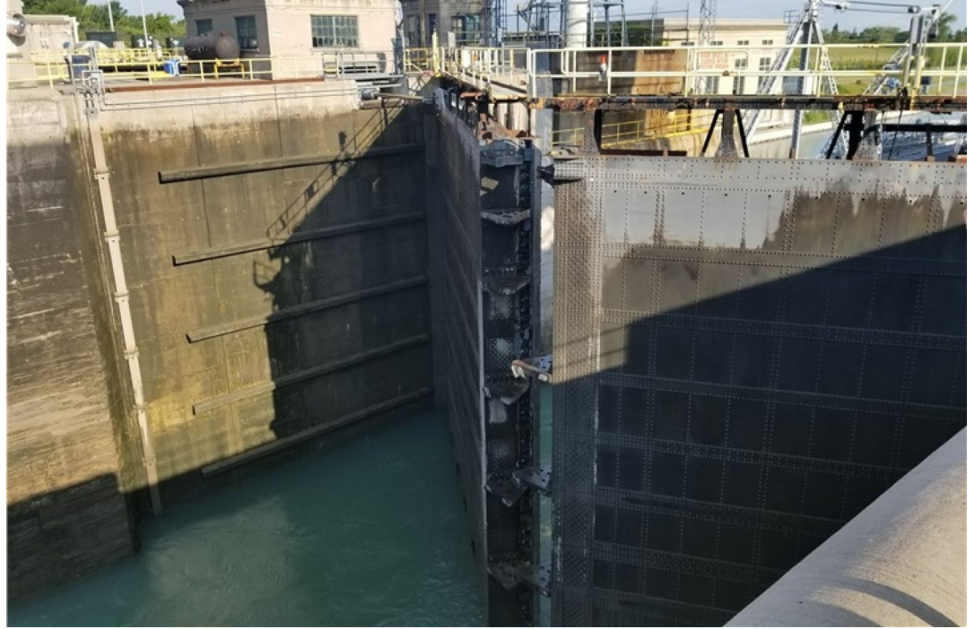
Écluse du canal Welland, Ontario | Relie le lac Ontario au lac Érié et fait partie de la voie maritime du St-Laurent au Canada

Le canal Welland en Ontario, qui relie le lac Ontario au lac Érié, fait partie de la voie maritime du Saint-Laurent au Canada. Cette infrastructure essentielle a été mise en service dans les années 1930. Sans des mesures appropriées mises en place, celle-ci atteindra prochainement sa fin de vie. GKM Consultants a été mandaté à plusieurs reprises pour rechercher, concevoir, acheter et installer des systèmes de surveillance. Plusieurs types d'instruments différents ont été installés au fil des ans : des fissuromètres, des jauges de contrainte, des accéléromètres, des convergencemètres et des inclinomètres. Bien que tous les projets aient été initialement conçus à titre d'enquêtes, ils se sont appuyés les uns sur les autres dans le but d'aider la Corporation de gestion de la voie maritime du Saint-Laurent à concevoir un plan exhaustif de surveillance de l'intégrité structurale.